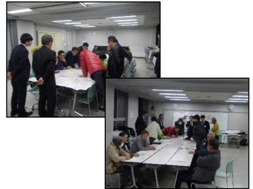
3月10日の勉強会風景 (松井まちづくりセンター2階)